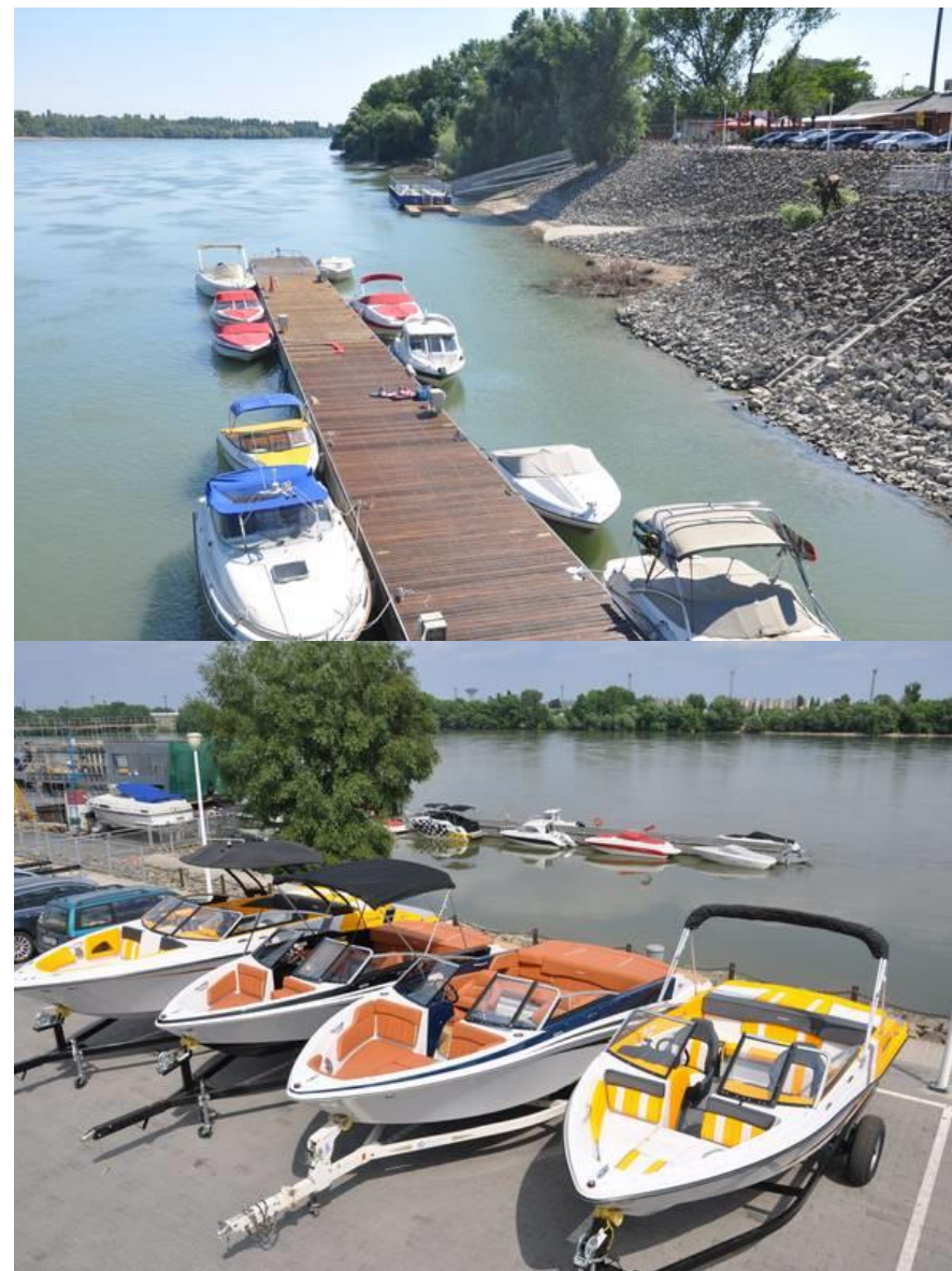
2. ábra: 28 yacht tárolására alkalmas kis yachtkikötő Budapest, Tomos Marina